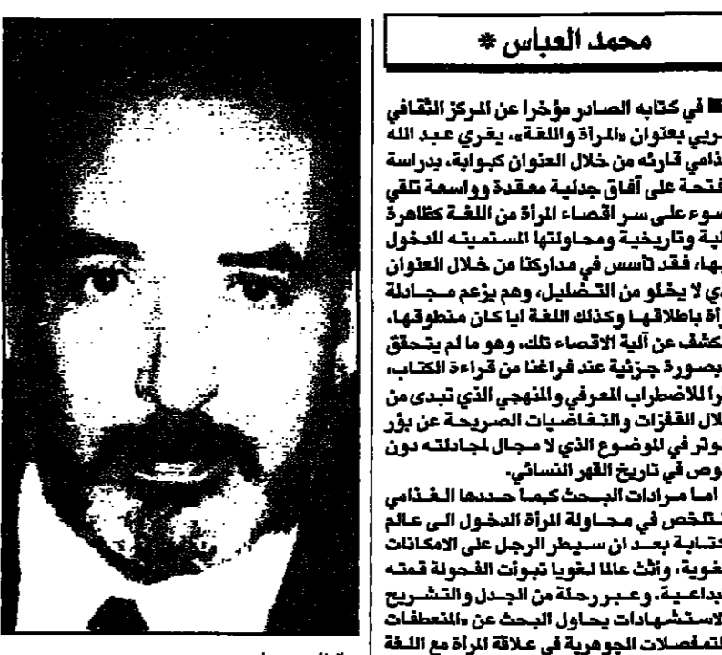
المعاصر من جلون

الظاهر لبني في كتابه الهام سوسولوجيا الغزل العربي، الذي عاد قاسوسياً إلى مشتقات الذكر والذكر اللغوية فسجول في وجداننا ما يشبه الصدمة، فالعروف أن القواميس هي إحدى الخبرات اللغوية والثقافية للتعلمة لأي لغة من اللغات وليس الأقوال العابرة، وهو ما تستسيه والغربة بالرجل ما ينبغي كلام الغدامي أو يضعه، كما أن الإحصار على منتج أدبي محدد ينبغي قصصية البحث، وإذا كان الغدامي قد أراد بهذا الفصل الكار من أصل الكتابة كانت تذكورية على عكس بعض التفسيرات، إلا أنه لم يفتح بفتح ولم يفسر قدر آثاره لاسئلة هامة وجديفة.